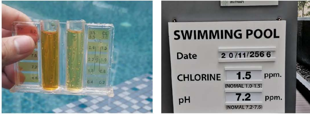
ภาพที่ 3.5.4-1 วิธีการตรวจวัด pH และ Free Chlorine