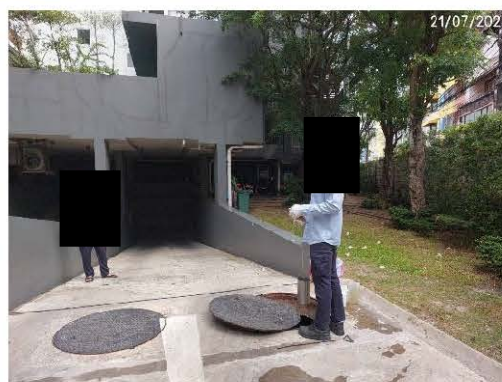
ภาพที่ 3.5.3-1 ตำแหน่งและวิธีการเก็บตัวอย่างน้ำทิ้ง